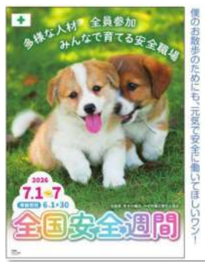
No.143 スローガン 小 B・動物 B2判