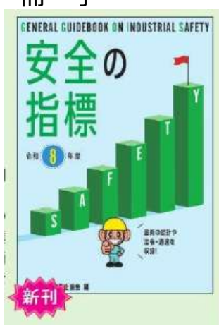
No.101 B6判 344頁

令和8年度全国安全週間実施要綱のほか、労働災害防止対策の基本、分野別の安全対策を解説。最新の労働災害統計や最新の指針・通達など安全衛生スタッフに必須の情報も収録。職場の安全衛生管理を進めるうえで欠かせない1冊。