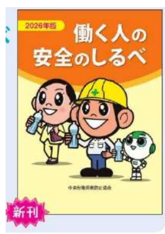
No.102 B6判 20頁 4色刷

働く人一人ひとりにあらためて自分の行動や自分の職場の危険を意識してもらうための個人向け小冊子。全国安全週間スローガンをはじめ、この時期に知っておきたい安全に関する話題についてイラストでわかりやすく紹介。